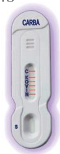
NG-Test CARBA 5

NOTE: Multiple lines or one line on K, O, V, I, N position must be considered as a positive result